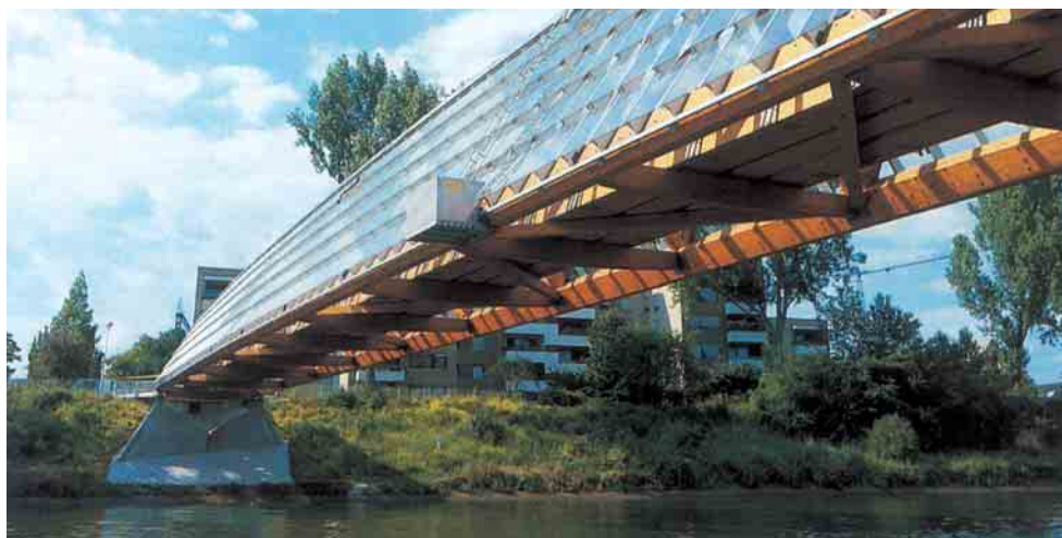
Ponte Remseck na Alemanha

Estruturas em madeira laminada colada – 1º lugar na fileira florestal