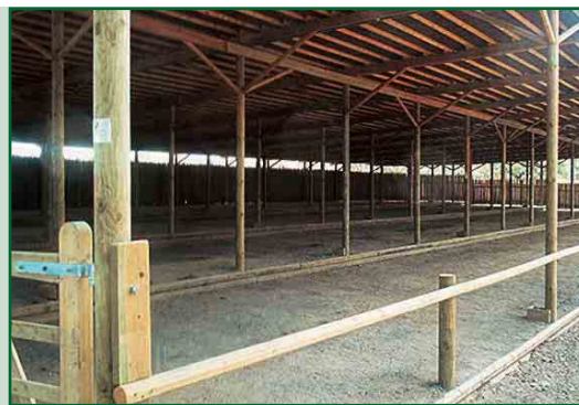
Estrutura CARMO para Leilão do Cavalo