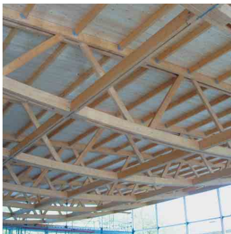
Obra Carmo Estruturas em Madeira, S.A – Piscina Monção

É leve e fácil de montar, sendo um material natural e renovável proveniente de florestas certificadas e geridas pelo homem contribuindo assim, para o desenvolvimento florestal e diminuição do CO 2 na atmosfera. Na produção, gasta menos energia que qualquer um dos seus concorrentes e quando longinquamente chegar ao seu fim de vida, é facilmente reciclável produzindo mais energia.